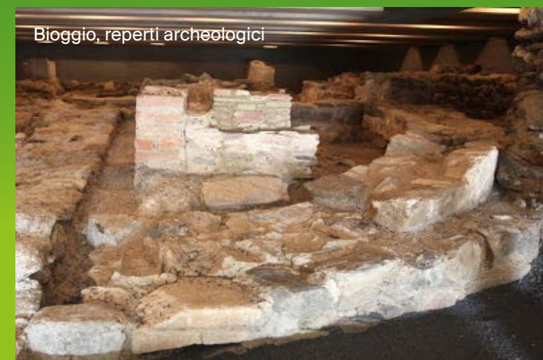
Bioggio, reperti archeologici