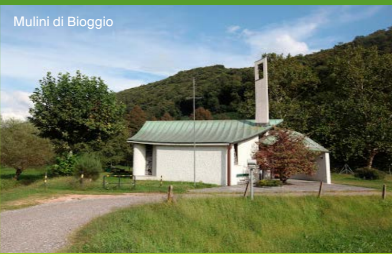
Mulini di Bioggio