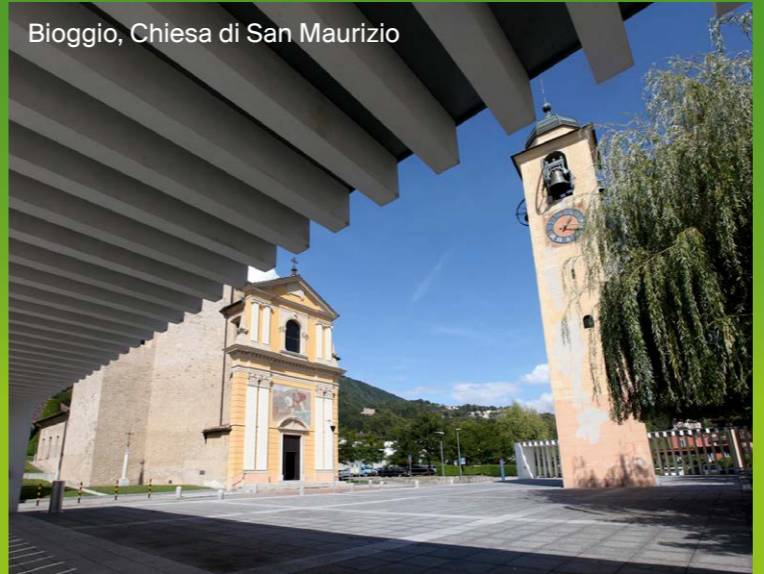
Bioggio, Chiesa di San Maurizio