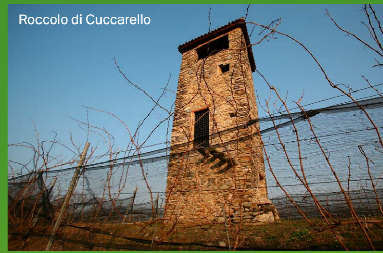
Roccolo di Cuccarello