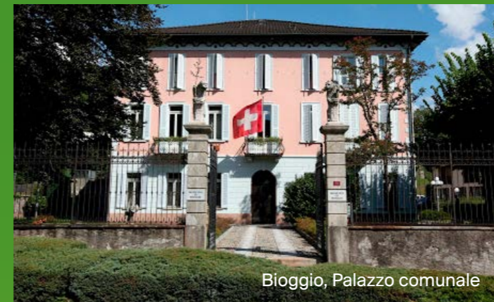
Bioggio, Palazzo comunale