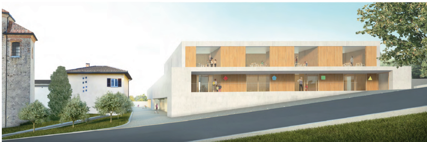
Progetto Nuova Scuola dell'Infanzia