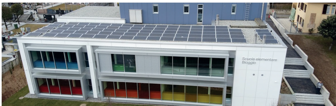
Istituto scolastico rinnovato